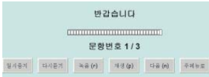
그림 4. [단어 듣고 녹음저장]의 실험화면

[단어보고 녹음저장] 메뉴는 실험자가 지정한 단어나 문장 목록을 화면에 보여 주고 참가자가 그것을 직접 발음하면서 컴퓨터에 자신의 두문자가 들어간 파일로 저장한다. [단어 듣고 녹음 저장]은 원어민의 모델 발음을 들려준 다음 그 목소리에 따라 최대한 가깝게 발음하여 저장한다. [단어 듣고 녹음 저장]메뉴를 선택하면 그림 4와 같이 나타난다.