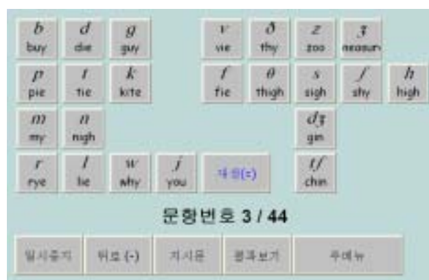
그림 6. [자음 선택하기]의 실험화면

외국어의 발음에서 개별 자음과 모음은 매우 중요하다. 특히, 우리말과 다른 외국어 자음과 모음 발음들은 어떤 면에서 차이가 있는지 학습자들이 구체적으로 알고 있어야 한다. 이 메뉴를 사용하여 외국어의 모음과 자음을 개별 학생에게 들려준 다음 어떤 발음이 문제가 되는지 파악하여 학생 개개인에게 필요한 교육을 시킬 수 있고, 동시에 한 교실에서 배우는 모든 학습자들의 문제점을 종합적으로 파악할 수 있을 것이다. 외국어 자음과 모음 발음기호가 익숙하지 않는 경우에는 해당 발음을 여러 번 들려주고 따라하게 하는 연습을 시킬 수 있다. 실제 정확한 발음을 익히지 않고 아무리 많은 수의 문장을 연습해 봐도 소용이 없는 경우가 많은데 이를 극복하기 위해서는 개별 자모음의 문제점을 찾아 교정해야한다. 이 메뉴를 선택하면 그림 6과 같은 실험화면이 나타난다.