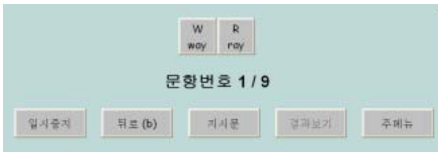
그림 7. [w-r선택]의 실험화면

마지막으로 두 개의 발음 가운데 어느 것인지 판단하게 하거나, 구별하게 하는 메뉴에 대해 알아본다. [w-r선택하기]는 합성한 음성의 지각 경계점이 어디인지를 확인하는 데 사용된다. 사람은 발음하면서도 동시에 자신의 목소리를 들으며 적절한 목소리인지 피드백을 이용하여 조절하게 된다(양병곤 1997). 만약 자신의 귀로 음을 구분할 수 없다면 피드백이 제대로 반영되지 않기 때문에 틀린 발음을 하게 된다. [정답보기] 기능이 포함된 메뉴를 이용하여 듣기 훈련을 통한 개별학습을 시킬 수도 있다. 그림 7은 이 메뉴를 선택했을 때 나타나는 실험 화면이다. [결과보기] 단추를 누르면 얼마나 정확히 단어를 듣고 바르게 판단했는지 알아볼 수 있다. 만약, 한국인이 어려워하는 p, f 발음을 실험 참가자가 얼마나 잘 구분하는지 등 구체적인 단어 쌍을 넣어서 들려주고 판단하게 하려면 [단어 듣고 녹음저장]에 제시한 것과 마찬가지로, [wr선택] 폴더 안의 signals 폴더에 p와 f로 시작하는 영어 발음을 편집하여 넣고, 이 폴더의 wrid.stm을 열어 폴더의 파일이름을 넣어준 뒤 저장하면 된다.