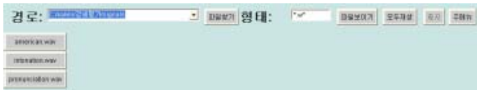
그림 3. 음성파일 재생 메뉴의 실행 화면

는 일이 자주 있지만 쉽게 특정한 단어나 문장의 발음을 재생하는 일은 매우 어렵다. 다행히 교실에 컴퓨터가 있거나 교사의 노트북이 있다면 kalvin 의 [음성파일재생] 기능을 활용하는 것이 좋은 효과를 얻을 수 있다. 그림 2에서 첫 번째 메뉴인 [음성파일 재생]메뉴를 선택하면 그림 3과 같이 나타난다.