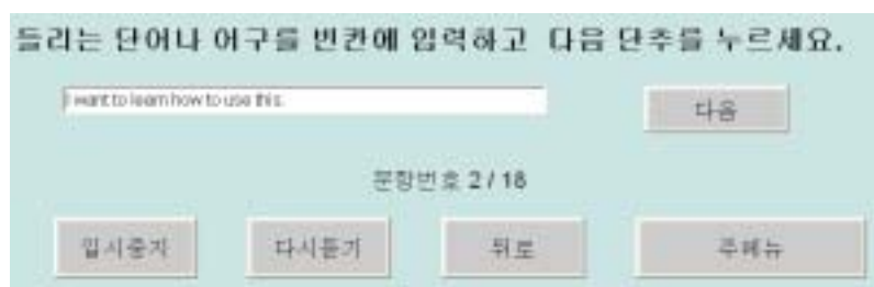
그림 5. [단어 듣고 적기]의 실험화면

학생들이 배운 단어나 어구 또는 문장을 들려준 뒤 컴퓨터에 직접 키보드로 입력하도록 할 수 있는 메뉴이다. 이 메뉴를 실행하면 그림 5와 같은 실험화면이 나타난다.